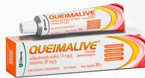
Queimalive Pomada 30g