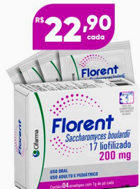
Florent 200mg 4 env. Sachê