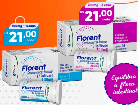
Florent Cápsulas Duras