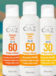
Protetor Solar Aerosol 200ml 30, 50, 60