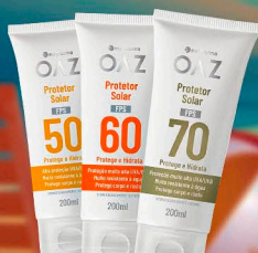
Protetor Solar 200ml 50, 60 e 70 FPS