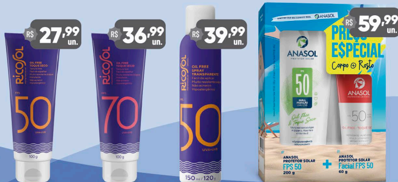
Ricosol Protetor Solar FPS 50 - 100g